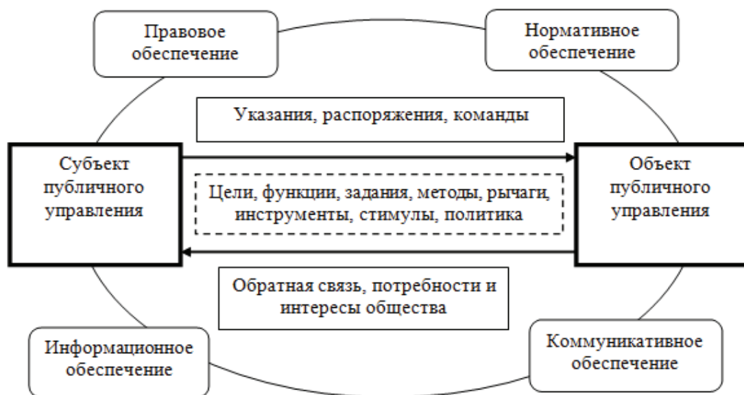
Рис. 1. Структура механизма публичного управления.

управления на объекты управления (социальные системы и процессы) с целью достижения целей государственного управления. Рассмотрев основные подходы к определению этого понятия, можно отметить, что ученые рассматривают его в таких аспектах, как систему, совокупность способов и средств, как деятельность.